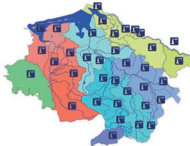
Leuchttürme des Wassernetzes Niedersachsen-Bremen

Wir bieten interessierten Bürgern fachliche Beratung in Fragen rund um die WRRL und den Gewässerschutz in Niedersachsen und Bremen. Allen bereits aktiven Gewässerschützern bieten wir die Möglichkeit, sich durch die Teilnahme an Seminaren und Vorträgen weiterzubilden und auszutauschen. Wir wollen Ideen und Konzepte zur ökologischen Verbesserung unserer Gewässer entwickeln und umsetzen.